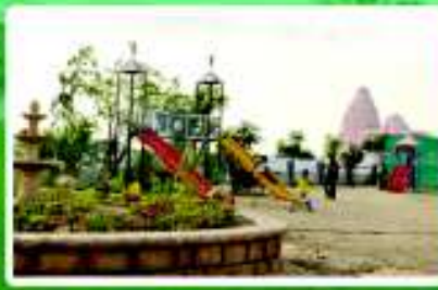
CHILDREN PLAY AREA