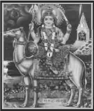
શ્રી મોમાઈ માતાય