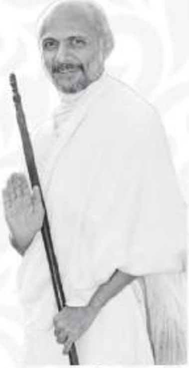
પરમ પૂજ્ય દિવ્ય તપસ્વી આચાર્ય શ્રી હંસરત્નસૂરીશ્વરજી મહારાજ

જ્યાં ૧૦૦ થી પણ વધુ નાના - મોટા જિનાલયો છે. જ્યાં ૩૬૫ દિવસ સાધનાની સરગમ ગવાતી હોય છે. જ્યાં દેવ ગુરૂના અન્ય ઉપાસકો વસે છે. જ્યાં બારે માસ પૂજ્ય સાધુ - સાધ્વીજી ભગવંતોના દર્શન સુલભ છે. જિનવચનોપાસના, ધર્મોપાસના જ્યાં હરદમ સદાબહાર હોય છે.