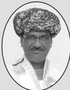
રવજી પાલણ ગડા (નવાગામ-ભચાઉ)