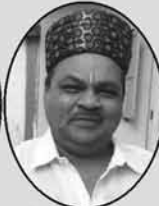
ભેયજી ભયુ ગડા (સામજીચારી)