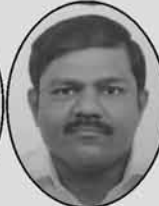
શાંતિલાલ વીરમ સત્રા (આઘોઈ)