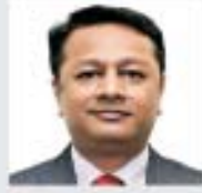
Sandeep Shah SS India Pvt Ltd.