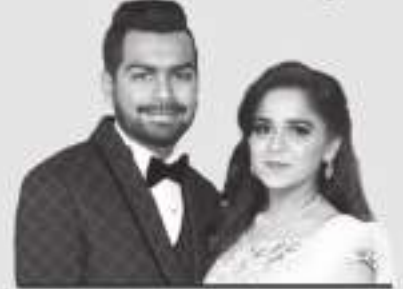
: દિકરી - જમાઈ :