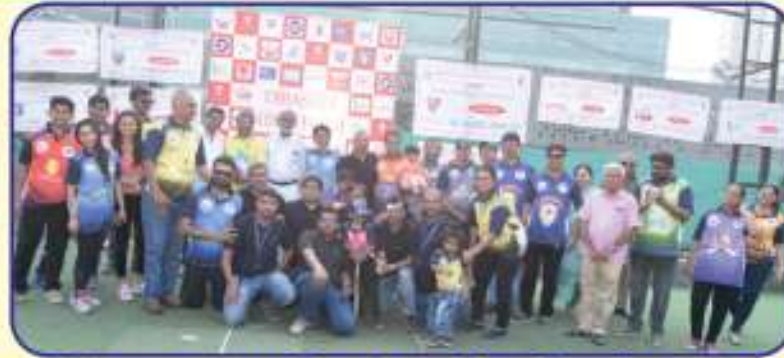
ડ્રેસ્ટીંગણ, દાતાઓ, ટીમ ઓનર્સ સાથે CYF ટીમ