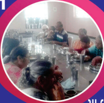
મા વર્ષના દાતા