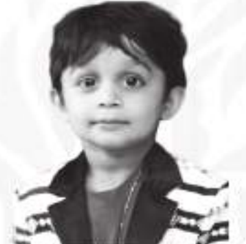
દર્વ ગૌરવ છેડા