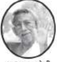
મહાસાત્મ યોગી આ.દે. શ્રીમદ્ વિજય કલાપૂર્ણસૂરિશ્વરજી મ.સા.

॥ શ્રી પદ્મ-જીત-હિર-કનક-દેવેન્દ્ર-કંચન-કલાપૂર્ણ-કલાપ્રભ સૂરિભ્યો નમઃ ॥